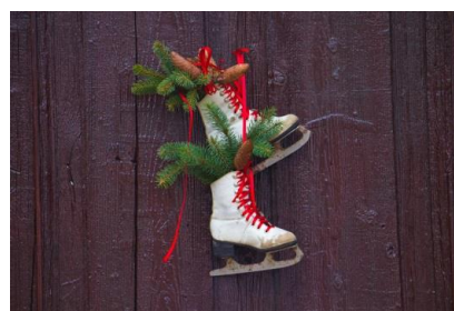
łyżwy jeździć na łyżwach