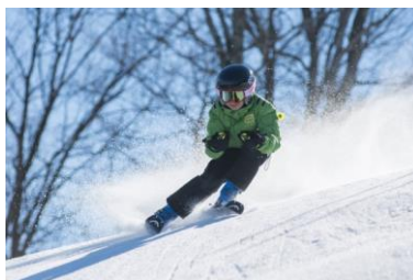
narty zjazdowe (zjazdówki) jeździć na nartach zjazdowych jeździć na zjazdówkach