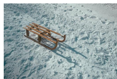
sanki jeździć na sankach